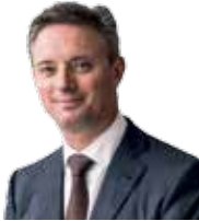
JEREMY WEIR Director Ejecutivo

Trafigura ha llegado a ser una de las principales empresas comercializadoras de materias primas del mundo gracias a la entrega de servicios confiables y eficientes a sus clientes y a la optimización de la cadena de suministro. Un aspecto integral de este proceso es nuestro compromiso de actuar de manera responsable.