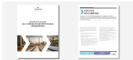
Política de Responsabilidad Corporativa y Principios Comerciales de Trafigura

Nuestro enfoque alinea a Trafigura con las mejores prácticas emergentes para las empresas multinacionales y en particular con los marcos de autoridad como los Principios Rectores de las Naciones Unidas en empresas y Derechos Humanos o los 'Principios de Ruggie'. También refleja las expectativas cambiantes de muchas de nuestras partes interesadas, desde las instituciones financieras a las comunidades locales.