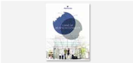
Código de Conducta Empresarial de Trafigura

Establecemos procedimientos adecuados para gestionar y controlar el negocio con eficacia y cumplir con los requisitos de nuestro Código de Conducta Empresarial.