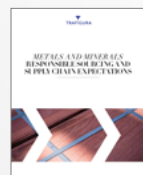
金属和矿产负责任采购及供应链要求